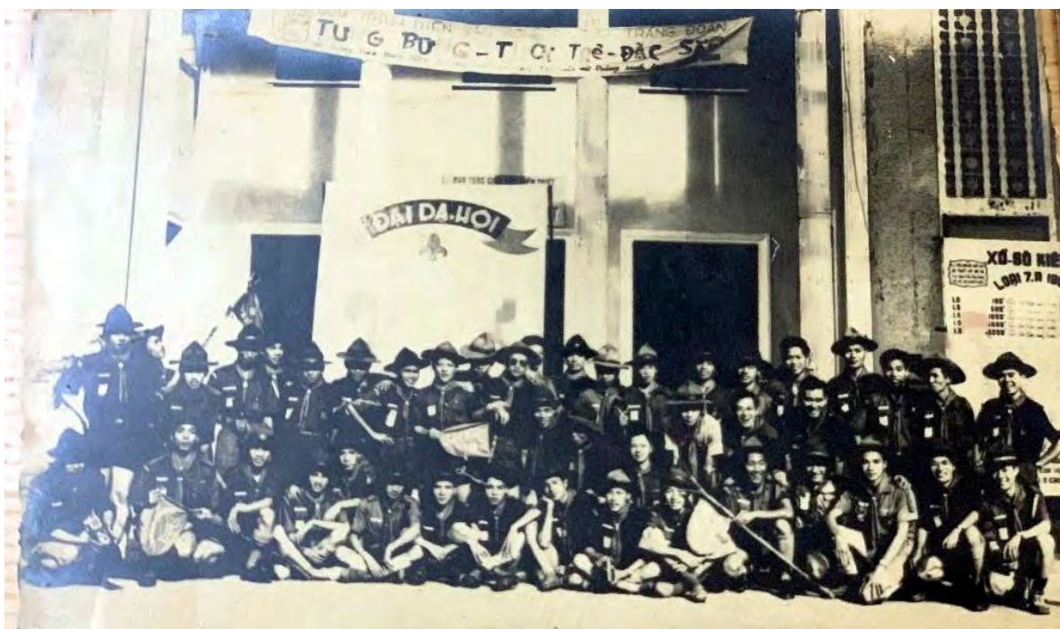
Tráng Đoàn Bạch Đằng 1960