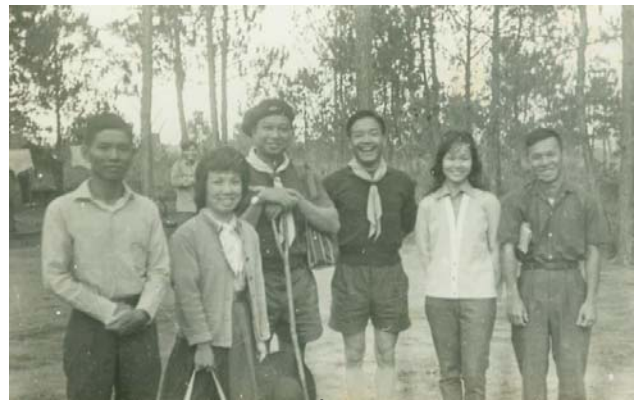
Dân làng Tân Hương rủ nhau về trại Tùng Nguyên 1961