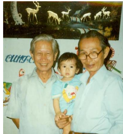
Tết Ất Sửu, 1985 tại Saigon

lội rừng, vượt suối trên vùng Việt Bắc. Sau tháng 4/75, vì đã can đảm góp ý với chánh quyền mới, Anh bị tập trung lao động khổ sai trên cao nguyên. Chị Thông tần tảo nuôi dạy con cái và vất vả ngược xuôi thăm chồng từ trại này qua trại khác. Suốt gần 10 năm, sức khỏe suy yếu, Anh về nhà trên đôi nạng gỗ.