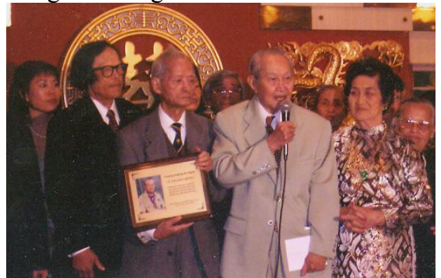
Lễ kỷ niệm 60 năm kết hôn tại Westminster – Tr. Lê Mộng Ngộ (thay mặt các trưởng HĐ) tặng quà anh chị Thông

Năm 1993, gia đình Anh đoàn tụ tại California. Các con trưởng thành, đời sống sung túc. Anh Chị sống hạnh phúc trong lúc tuổi già.